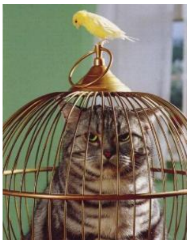
Det vil blive bedre