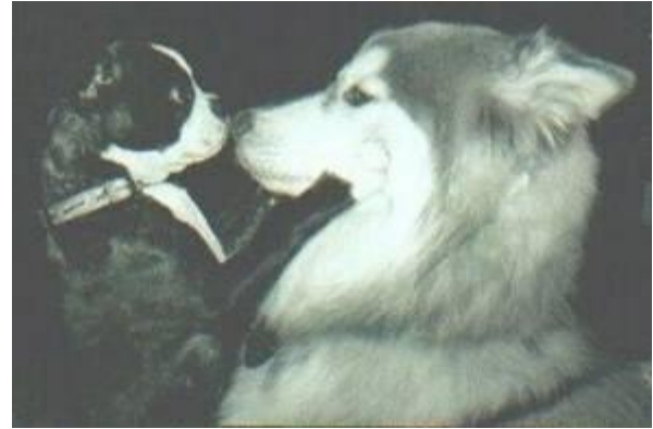
Sig: " Jeg elsker dig..."