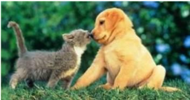
Elsk nogen af hele dit hjerte...