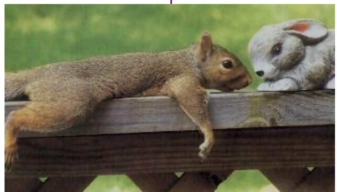
Bliv forelsket i nogen...