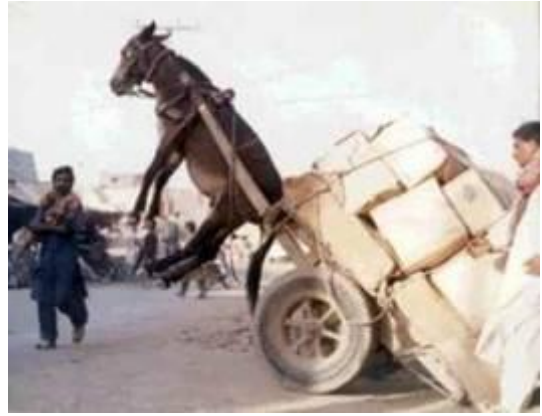
Forbliv rolig, selvom alt ser håbløst ud