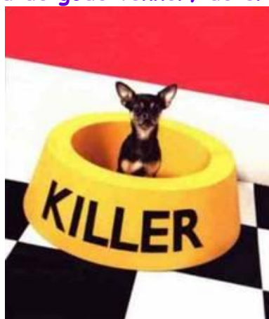
Lev op til dit navn.