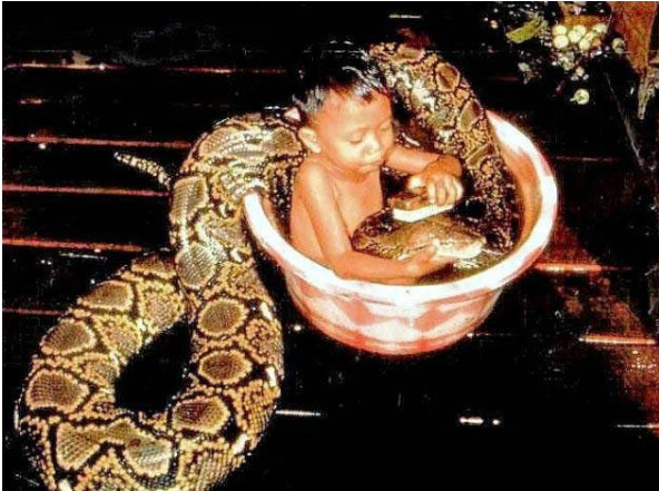
Gå jævnligt i bad