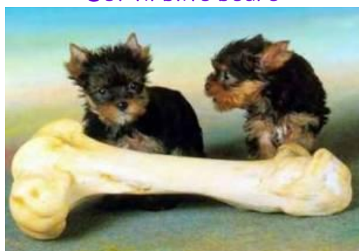
Del med vennerne