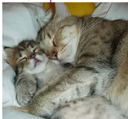
Der er altid en eller anden, som elsker dig mere end du aner