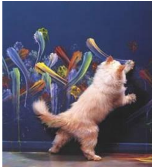
Udtryk dig kreativt