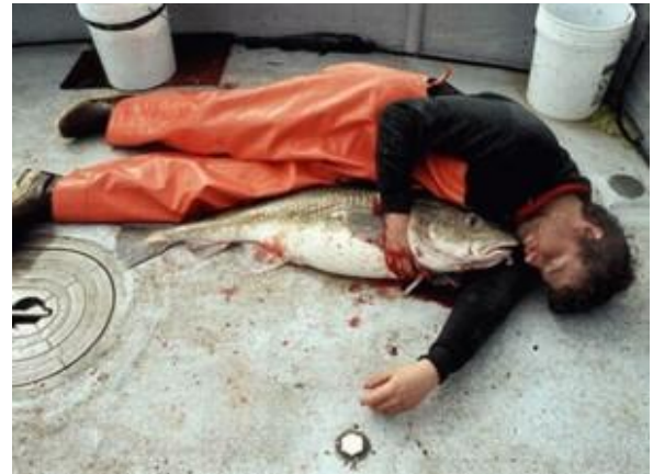
Træk gerne torsk i land.