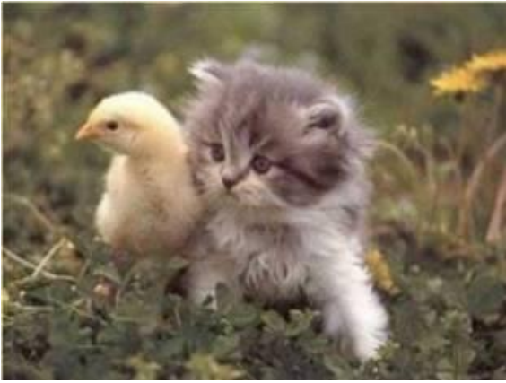
Mød nye folk, også selvom de ser anderledes ud end dig