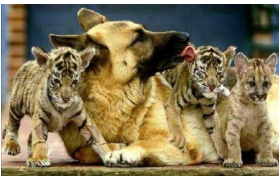
Els dine venner, uanset hvemde er....