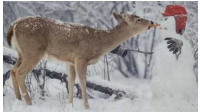
Spild ikke maden.....