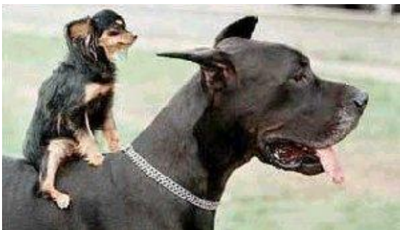
Hjælp en ven i nød.....