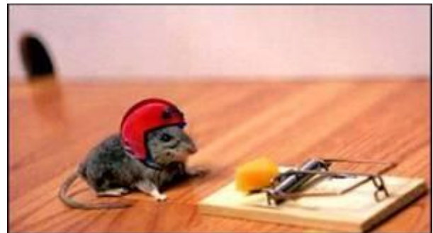
Løb af og til en risiko...