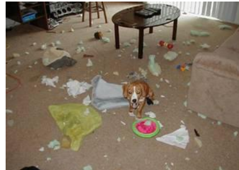
Prøv at have det lidt sjovt hver dag. ...det er vigtigt !