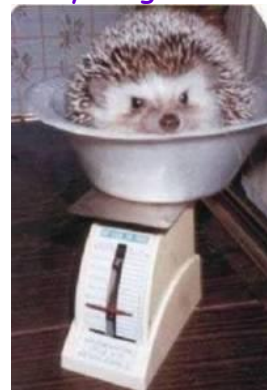
Vær ikke hysterisk med din vægt - Det er kun et tal