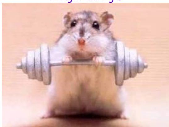
Motioner for at holde dig i form.