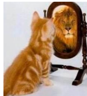
Tro på dig selv...