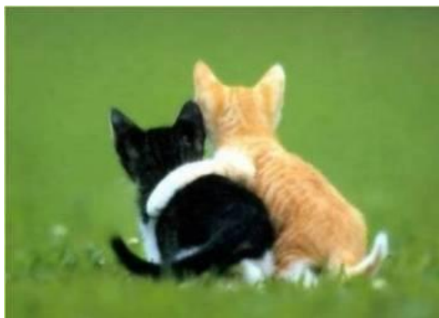
Hold ved de gode venner; de er sjældne