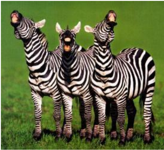
Del dine vittigheder med venner