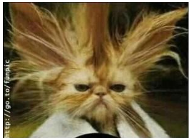
Prøv noget nyt