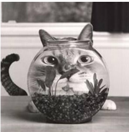
Tag din fremtoning alvorlig...