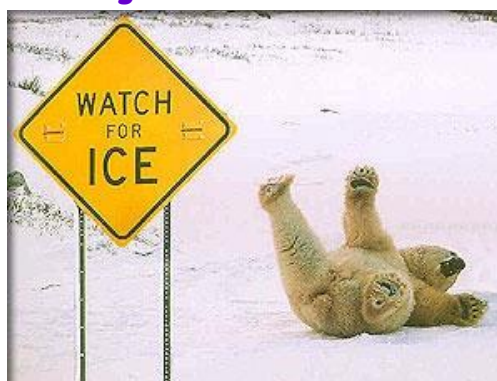
Pas på hvor du går