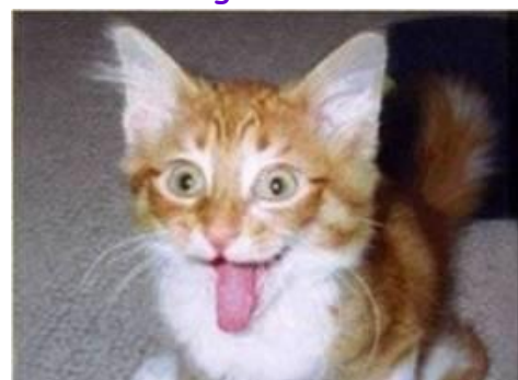
Vær skør ... Når som helst du har chancen