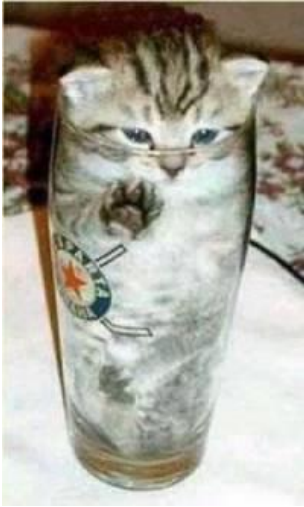
Prøv altid at se glasset som halvfuldt.