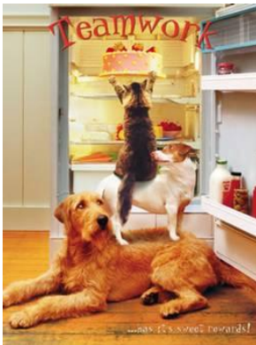
Arbejd sammen som et team...