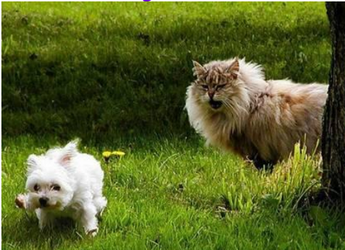
Vær modig... men det er Ok at være bange engang imellem