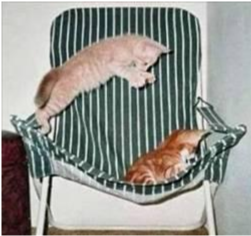
Vær altid klar til overraskelse...